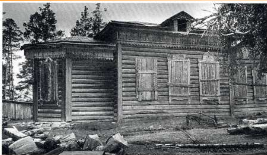
Николаевская церковь с. Хор-Тагна. 1994 г.