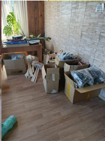
CAMON 30 • 23mm f/1.88 1/50s ISO165