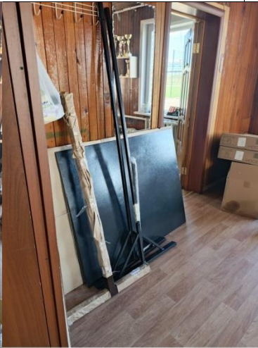
CAMON 30 • 23mm f/1.88 1/50s ISO363