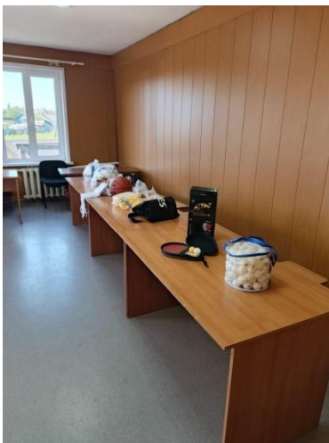
CAMON 30 • 23mm f/1.88 1/50s ISO157