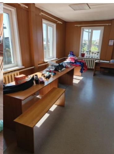
CAMON 30 • 23mm f/1.88 1/50s ISO78