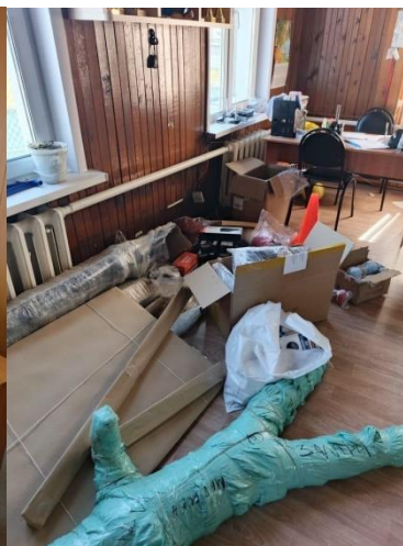
CAMON 30 • 23mm f/1.88 1/50s ISO232