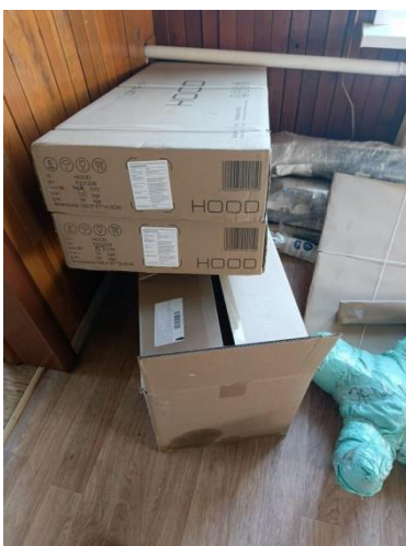
CAMON 30 • 23mm f/1.88 1/50s ISO541