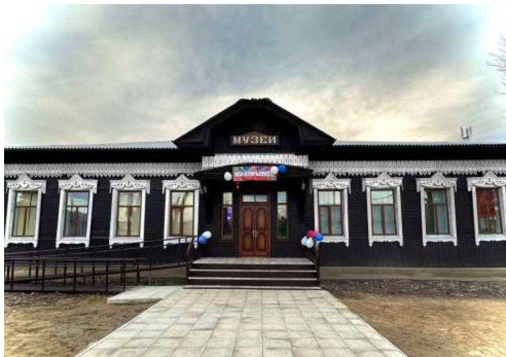
Заларинский районный краеведческий музей