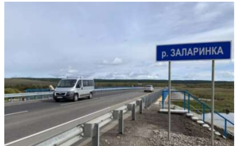
Развитая транспортная инфраструктура