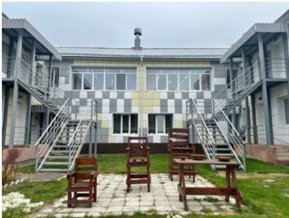
Шесть детских садов (Малыш)