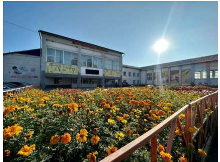
3 учреждения культурно-досугового типа (Родник)