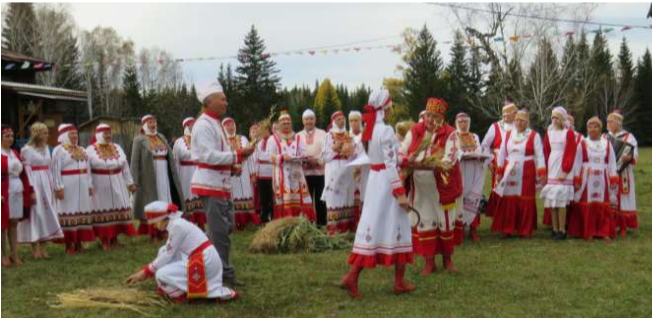
Многонациональность поселка и развитый туризм