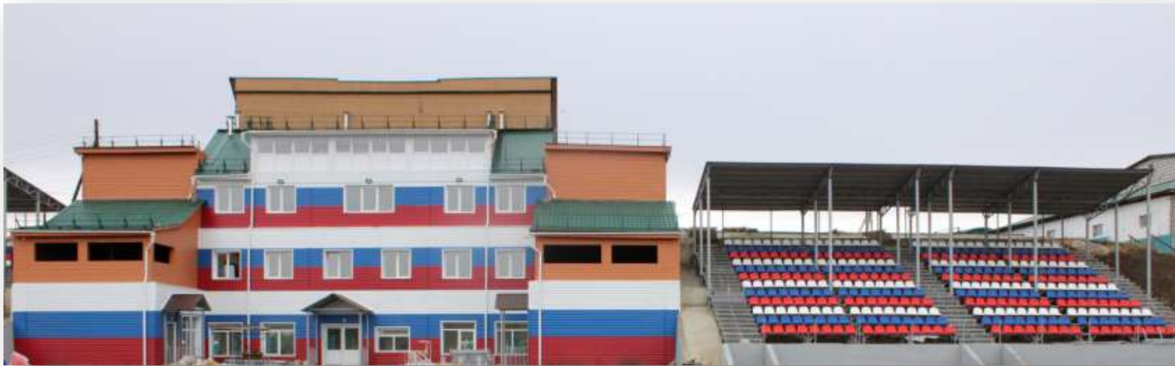
Спортивная школа и стадион «Урожай»