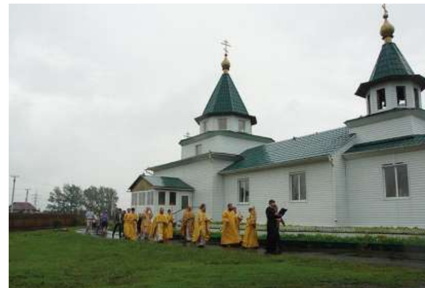
Храм во имя святых преподобномучениц Елизаветы и Варвары п. Залари