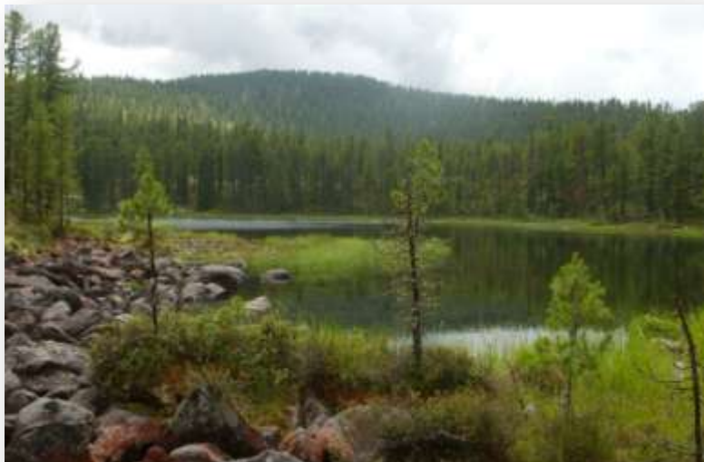
Близость к горам и красивая природа