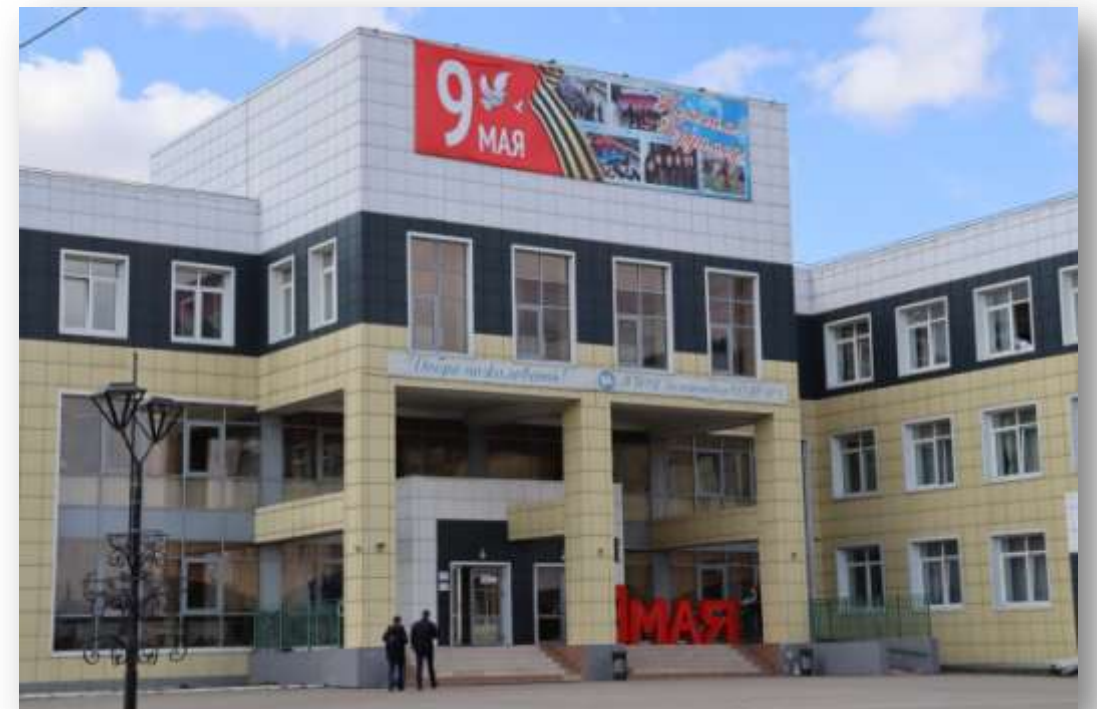
Три общеобразовательных организаций (ЗСШ № 1)